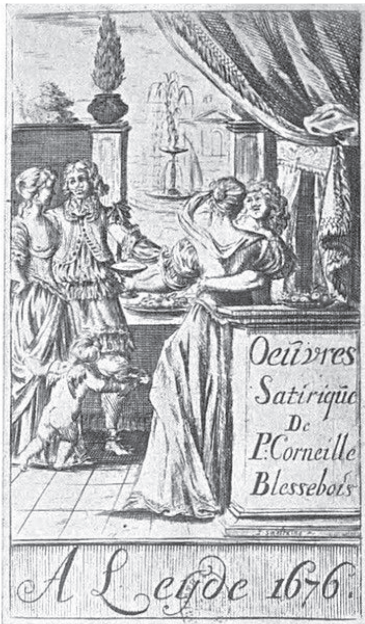
Oeuvres satiriques de P.-Corneille Blessebois, frontispice gravé par Smeltzing, Leyde, 1676